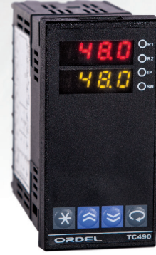
İki Zamanlı TC490

TC491 Model cihazlar endüstriyel ortamlarda ihtiyaç duyulan farklı şekillerde zamanlama işlemleri için tasarlanmıştır. Bu cihaz üç farklı MOD'da çalışabilen zamanlayıcı içerir. Bu zamanlayıcının zaman birimi saniye, dakika veya saat olarak seçilebilir ve 0,00-99,99/0-999 değerleri arasında set edilebilir. 100-240Vac/dc (Üniversal) ve 24Vac/dc besleme gerilimi bulunmaktadır.