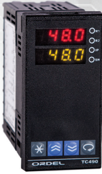
Tek Zamanlı TC491